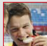
Patrick Hausding Wasserspringen Silber bei Olympia