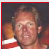
Jochen Schümann Segeln Olympiasieger