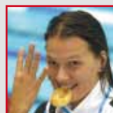
Franziska van Almsick Schwimmen Weltmeisterin