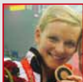
Ditte Kotzian Wasserspringen Bronze bei Olympia