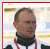
Norman Bröckl Kanurennsport Bronze bei Olympia