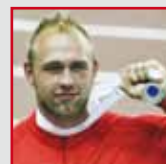
Robert Harting Leichtathletik Vize-Weltmeister