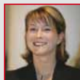
Claudia Pechstein Eisschnelllauf Olympiasiegerin