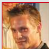
Andreas Wecker Turnen Olympiasieger