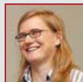
Jenny Wolf Eisschnelllauf Weltmeisterin